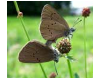
Dunkler Wiesenknopf-Ameisenbläuling auf der Blüte des Großen Wiesenknopfs

Der Große Wiesenknopf ist in Europa (außer im Norden) und in Zentralasien weit verbreitet. Sächsische Vorkommen finden sich vor allem im Einzugsgebiet der Elbe und ihrer Nebenflüsse sowie in Ost- und Westsachsen auf mäßig trockenen bis feuchten Mager- und Frischwiesen, Feuchtwiesen und extensiv genutzten Weiden, auch in feuchten Straßengraben.