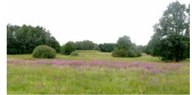
Lebensraum artenreiches Feuchtgrünland

Der Große Wiesenknopf ist in Europa (außer im Norden) und in Zentralasien weit verbreitet. Sächsische Vorkommen finden sich vor allem im Einzugsgebiet der Elbe und ihrer Nebenflüsse sowie in Ost- und Westsachsen auf mäßig trockenen bis feuchten Mager- und Frischwiesen, Feuchtwiesen und extensiv genutzten Weiden, auch in feuchten Straßengraben.