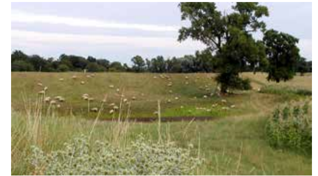
Extensiv genutztes, mageres Grünland

Das natürliche Verbreitungsgebiet des Feld-Mannstreu erstreckt sich von Mittel- nach Südeuropa und darüber hinaus. In Deutschland ist die Pflanze vor allem im Elb- und Rheintal sowie im Maingebiet anzutreffen. Die Vorkommen in Sachsen erstrecken sich vor allem entlang des Elbtals. Hier wächst der Feld-Mannstreu auf trockenen Grasflächen und beweidetem Grünland, an Böschungen und Dämmen, auf steinigem Untergründen, auf sonnigem Kalk-Magerrasen und an Wegrändern.