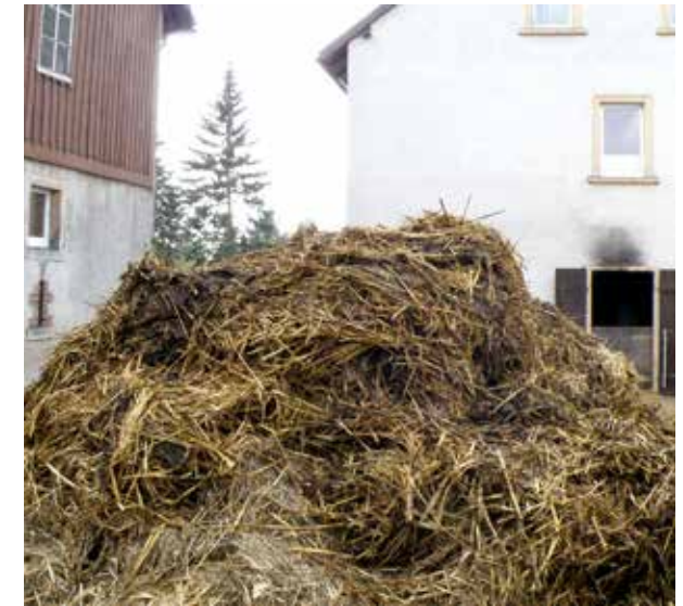
Lebensraum bäuerlicher Hofstandort

Der in ganz Europa beheimatete Gute Heinrich ist auch in Sachsen überall zu Hause, lediglich in den von Sandböden geprägten nördlichen Regionen kommt er seltener vor. Er bevorzugt sehr stickstoffreiche Böden. Man findet ihn fast ausschließlich in Dörfern an Dungplätzen, auf stickstoffreichen Stauden- und Unkrautfluren, an frischen bis feuchten Wegrändern und an Mauern.